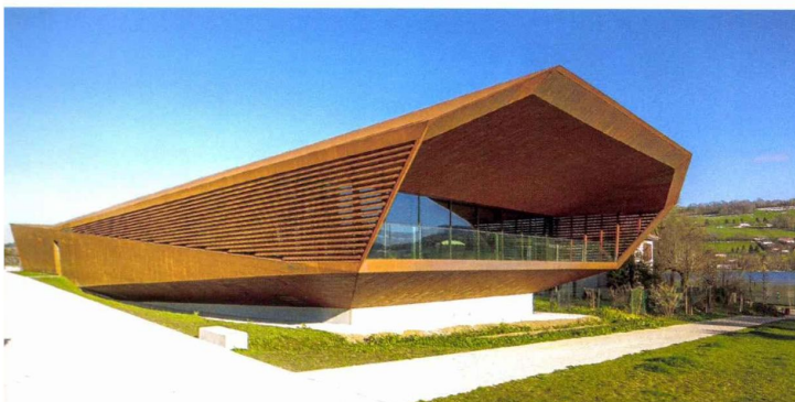
Le tout nouveau Musée archéologique du lac de Paladru, en Isère.

Sa forme évoque une coque de bateau, en hommage à la pirogue monoxyle (taillée dans une unique pièce de bois) repêchée au fond du lac de Paladru, en Isère, en 1962... Après deux ans de travaux et 6 millions d'euros de budget, le Musée archéologique du lac de Paladru (Malp), sous appellation Musée de France, ouvre au public le 7 juin. Conçu par l'agence Basalt, à qui l'on doit notamment le Muséum de Bordeaux, l'équipement bardé de métal oxydé et muni d'un toit végétalisé est dédié aux vestiges archéologiques engloutis sous les eaux du lac depuis près de 5 000 ans. Avec 600 objets issus de quatre décennies de fouilles, le Malp offre un éclairage exceptionnel sur la vie des hommes de ces rivages à deux époques, le Néolithique et l'an mil. malp.fr