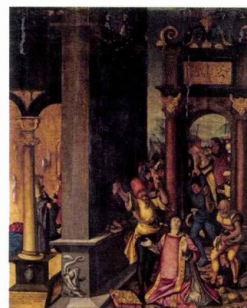
Hans Baldung Grien La Lapidation de saint Étienne , 1522

Sous l'effet de la chaleur, le bois sur lequel avait été marouflée la toile s'était gondolé et les résidus de suie avaient encrassé la peinture... Considérée comme irrécupérable après un incendie survenu en 1947, la Lapidation de saint Étienne de Hans Baldung Grien, réalisée en 1522, avait été reléguée dans les réserves des Musées de Strasbourg. Le tableau de ce maître de la Renaissance allemande vient de retrouver une partie de sa lisibilité grâce à une exceptionnelle restauration entreprise dans les ateliers du Centre de recherche et de restauration des musées de France de Versailles. Il est désormais visible au musée de l'Œuvre Notre-Dame, en compagnie de cinq autres peintures de l'artiste. musees.strasbourg.eu